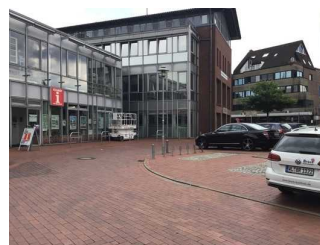
Parkplatz Tourist- Info