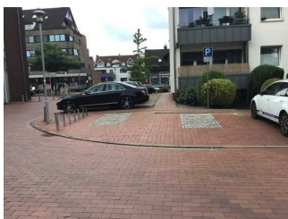
Parkplatz Tourist- Info