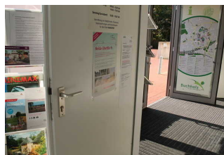
Eingangstür Tourist- Info