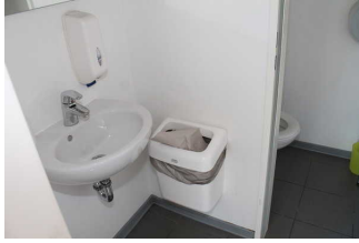
Halböffentliches WC Tourist-Info Buchholz