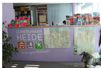
Tresen Tourist- Information Buchholz