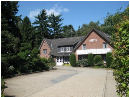
Außenbereich mit Parkplatz