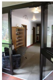
Zuwegung zum Zimmer