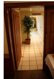
Zuwegung zum Zimmer