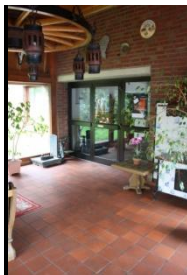
Zuwegung zum Zimmer