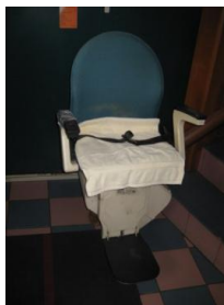
Treppenlift zum Zimmer