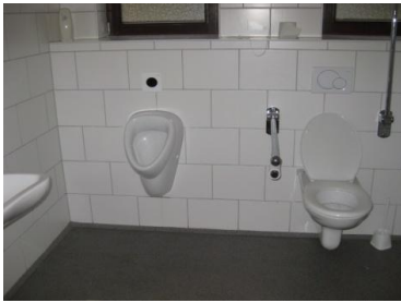
WC für Menschen mit Behinderung