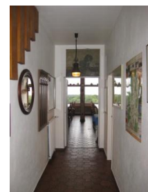
Flur zum WC