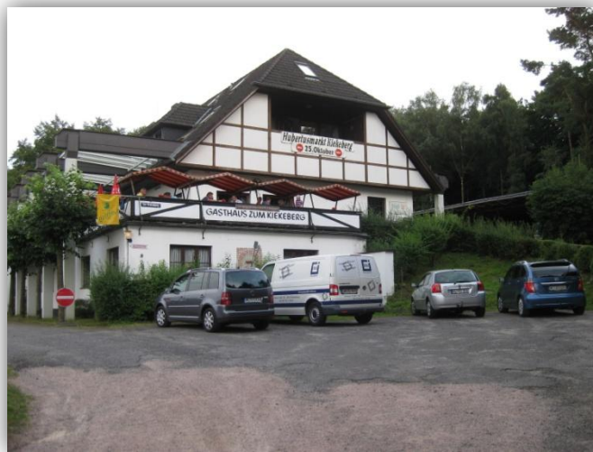
Außenansicht des Gasthauses