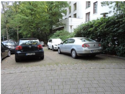
Abb. 2: Parkplatz