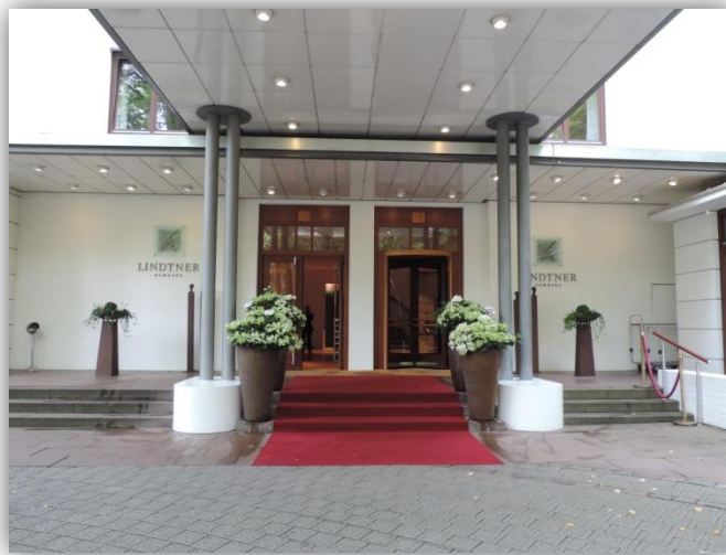
Abbildung 1: Eingangsbereich des Hotels