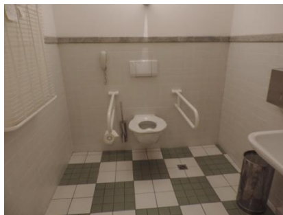
Abb. 12: Öffentl. WC Damen