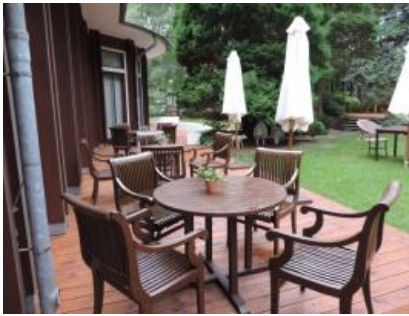
Abb. 14: Terrasse