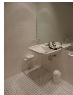
Abb. 10: Badezimmer 211