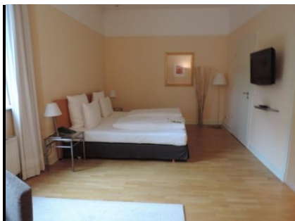
Abb. 8: Zimmer 211