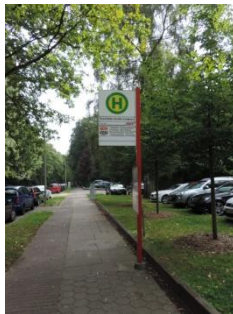
Abb. 3: Bushaltestelle