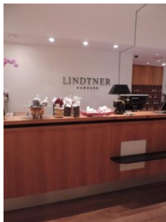
Abb. 5: Rezeption