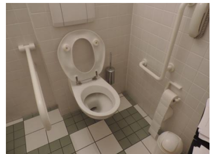
Abb. 13: Öffentl. WC Herren