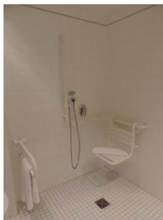
Abb. 9: Badezimmer 211