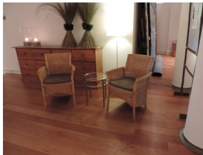
Abb. 6: Rezeption