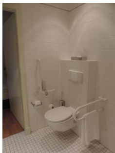
Abb. 11: Badezimmer 211