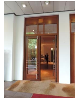
Abb. 4: Haupteingang