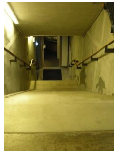
Abb. 7: Treppe EG zu 1. OG