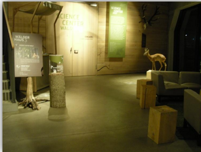
Abbildung 1: Innenansicht Science Center Wald