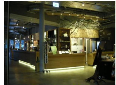
Abb. 4: Kasse / Empfang