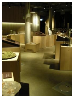
Abb. 6: Ausstellungsraum