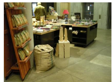
Abb. 11: Shop