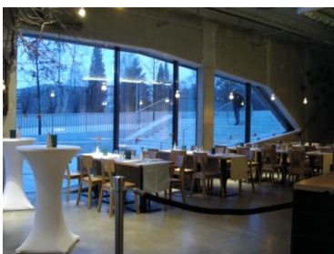
Abb. 9: Restaurant / Café