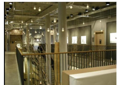
Abb.8: Galerie im 1. OG