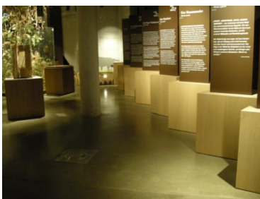
Abb. 5: Ausstellungsraum