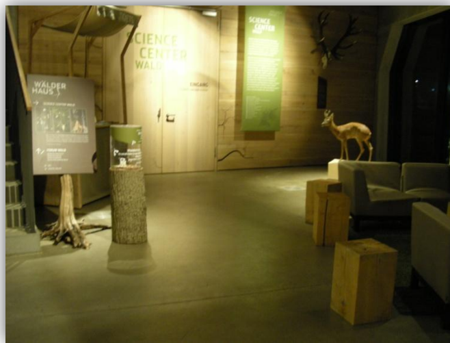
Abbildung 1: Innenansicht Science Center Wald