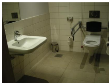
Abb. 10: WC