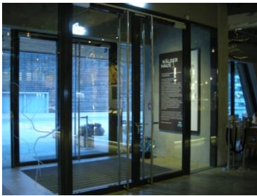
Abb. 2: Haupteingang