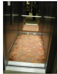
Abb. 7: Aufzug