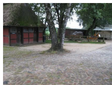
Außenbereich des Museums