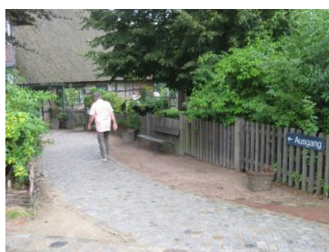
Außenbereich des Museums